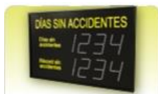
Edición datos del display

El menú principal del software consta de: (Puede clicar encima para ir directamente al apartado)